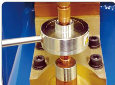
负荷传感器上部照片