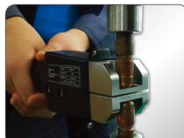
绝缘性负荷传感器